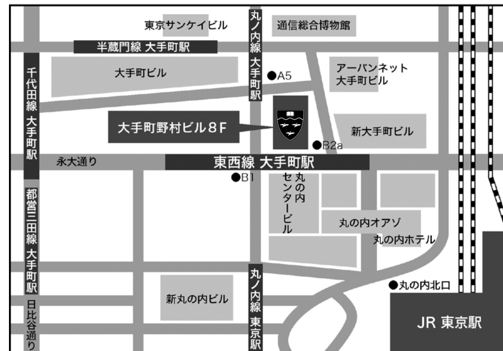
地下鉄大手町駅 東西線 (B2a) 出口・丸の内線 (A5) 出口直結 JR東京駅 丸の内北口から徒歩5分